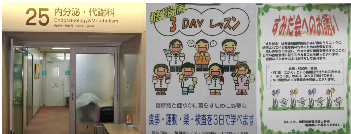
内分泌代謝科外来